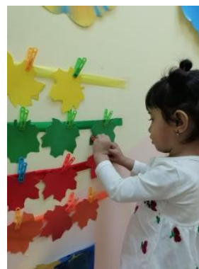
«Подбери по цвету»»