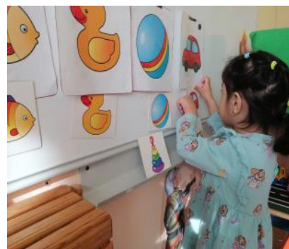
Игровое задание «Большой – маленький»