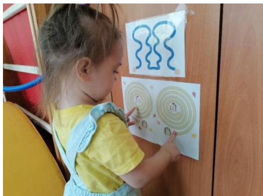
«Разноцветные дорожки»-элементы нейрогимнастики