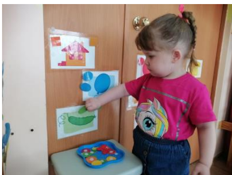
Игровое задание «Подбери пару»

Данная технология универсальный инструмент, представляющая возможность расширить жизненный опыт детей, развивать мелкую моторику, логику и мышление, она помогает ненавязчиво закрепить и расширить полученный детьми опыт и сделать образовательную деятельность яркой.